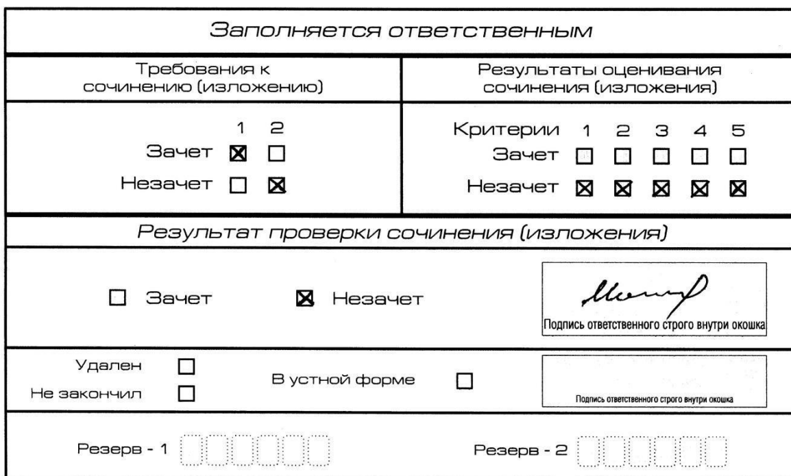
Рис. 9. Область для оценки работы

Если итоговое сочинение (изложение) соответствует требованию № 1 и требованию № 2, то выставляется «зачет» за выполнение требования № 1 и требования № 2. Указанные сочинения (изложения) далее оцениваются по критериям.