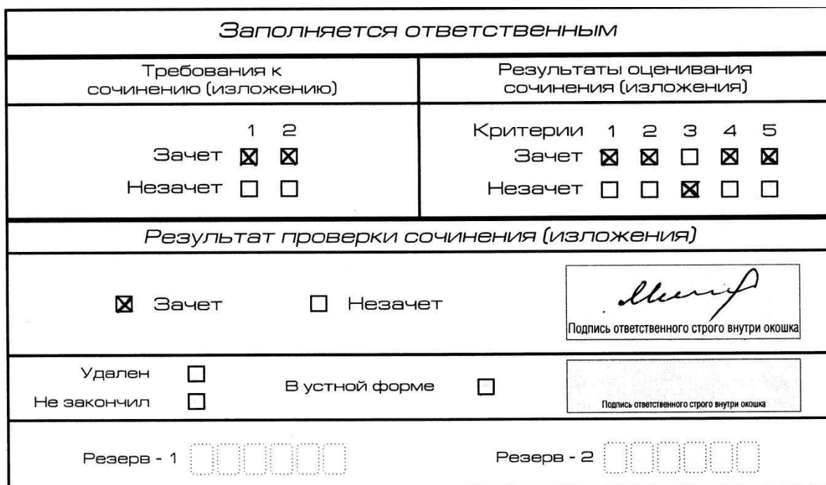
Рис. 10. Область для оценки работы

3. Во всех остальных случаях итоговое сочинение (изложение) проверяется по всем пяти критериям и оценивается по системе «зачет»/«незачет».