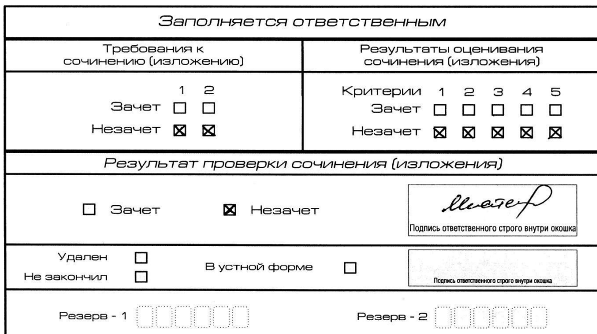
Рис. 8. Область для оценки работы