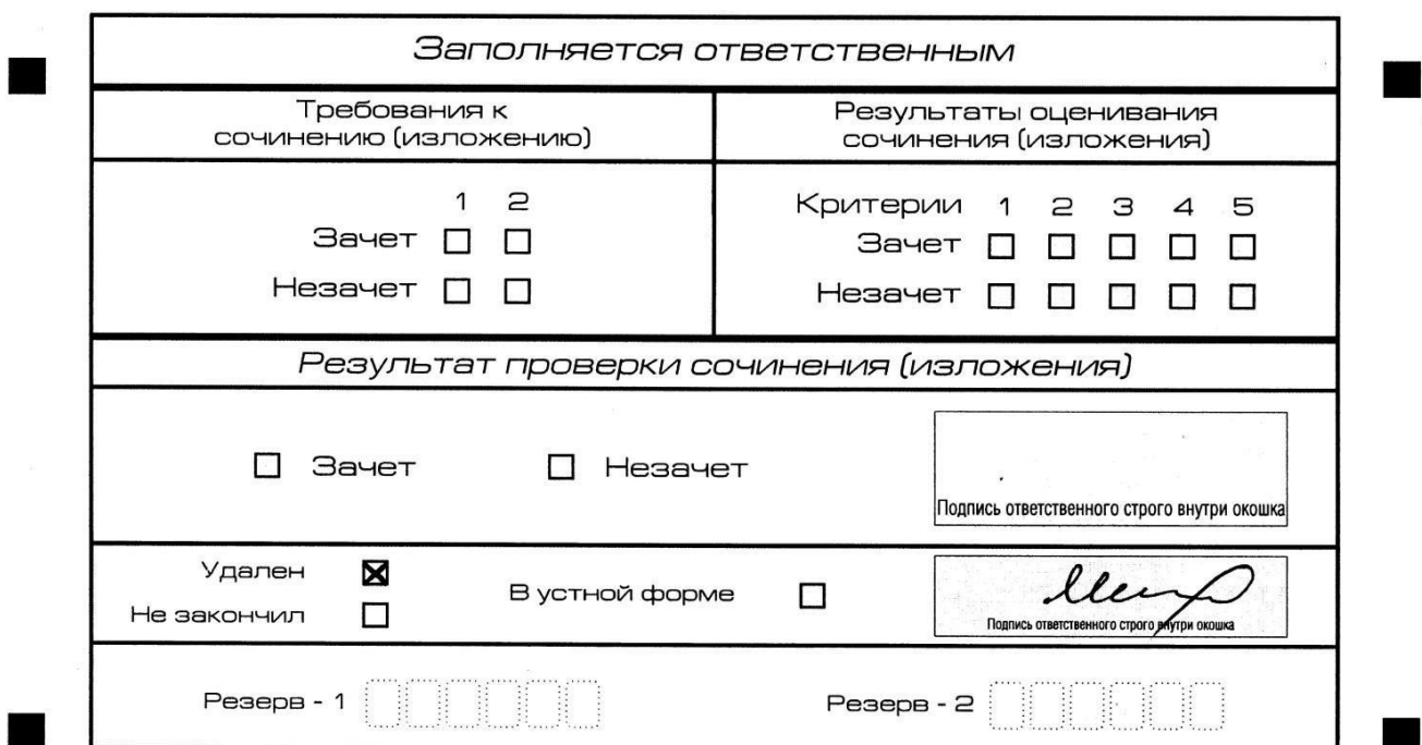
Рис. 13. Заполнение полей нижней части бланка регистрации (удаление с экзамена)

В случае если участник итогового сочинения (изложения) нарушил установленные требования, изложенные в пункте 28 Порядка проведения государственной итоговой аттестации по образовательным программам среднего общего образования (приказ Минпросвещения России и Рособрнанадзора от 4 апреля 2023 г. № 232/551), он удаляется с итогового сочинения (изложения). Член комиссии по проведению итогового сочинения (изложения) составляет «Акт об удалении участника итогового сочинения (изложения)» (форма ИС-09), вносит соответствующую отметку в форму ИС-05 «Ведомость проведения итогового сочинения (изложения) в учебном кабинете ОО (месте проведения)» (участник итогового сочинения (изложения) должен поставить свою подпись в указанной форме). В бланке регистрации указанного участника итогового сочинения (изложения) необходимо внести отметку «Х» в поле «Удален». Внесение отметки в поле «Удален» подтверждается подписью члена комиссии по проведению итогового сочинения (изложения) (см. рис. 13).